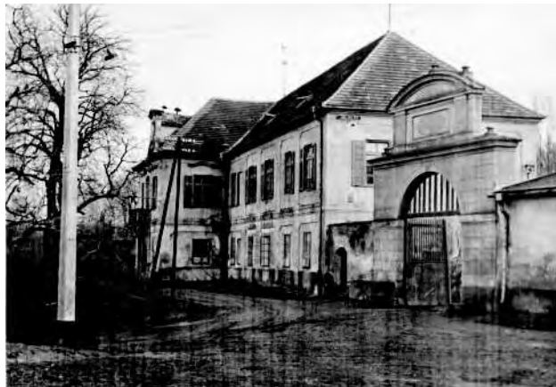
Obrázok 1. Lobeč, 1961 – od terapeutické k psychoterapeutické komunitě.

Porušíme tradici a místo uvedení předností naší psychoterapie, integrované psychoterapie (Knobloch), uvedeme její nedostatek, který zčásti sdílí s ostatními individuálními psychoterapiemi v odhalování a odstraňování sebedoprývajícího (kontraproduktivního) chování – tedy trampot, které si pacient nevědomky způsobuje sám. Je to jeden z nejdůležitějších úkolů psychoterapie – a ten nejtěžší. Autorům integrované psychoterapie otevřely oči jejich psychoterapeutické komunity, zejména v Lobči a v Day House na University of British Columbia ve Vancouveru v Kanadě (obr. 1, 2, 3).