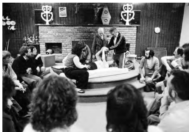
Obrázok 2. Z Day House v Kanadě.