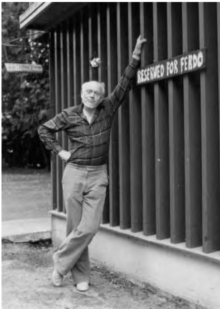
Obrázok 3. Day House v Kanadě, Reserved for Ferdo.

Výhody psychoterapeutické komunity potvrzuje výzkum s užitím Knoblochova dotazníku sebepodrávajícího chování (selfdefeating behavior), SELFDEF – 10517 pacientů v Day House vyplnilo dotazník před a po léčbě a totéž učinily jejich signifikantní osoby. Rozdíl, před léčbou a po léčbě, je vysoce signifikantní. Naproti tomu v individuální terapii dotazníkové zlepšení nedosáhlo významnosti (signifikance) (obr. 4).