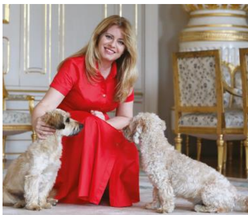
Obr. 1. Prezidentka Slovenskej republiky Z. Čaputová so svojimi psami Františkom a Egonom...

Ale ako vôbec dokážu ľudia a zvieratá vytvoriť blízke spojenie? Čo umožňuje zvieratám, že majú na ľudí liečivý vplyv? A ako môžeme najlepšie využiť toto poznanie pre zvierateľom asistovanú terapiu?